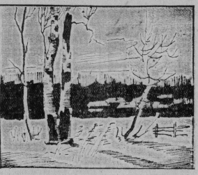
СНЕГ В НОБРЕ. Рис. Н. Петрова.

Казуету рубит по дворе, Выски впередик с хрустом. А ковырялки—детворе: Питательном и вкусою. Скрывает сапустые ласты, Как норовит галатки. А пал вогами похвостат Октябрьская поршом. Последним авиалаком земли, Томительным и грустным, В студийном воздухе разлет Острейший дух напустый. Тру-ту, тап-тап, тук-тук, Тил-ти-тил... Стучит в сорты танки. На голых авиалаках сидят Синими, спрятав лапки. Казуету рубит во дворам, Струны стучат по лапам. Все ковырялки—детворе. Все гудеячки—пшанам. В. СТАРКОВ.