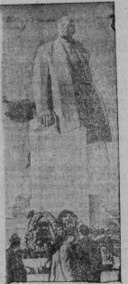
Болгария. Недалеко в Софии открыт памятник В. И. Ленину.