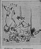
Собая — друг человека.