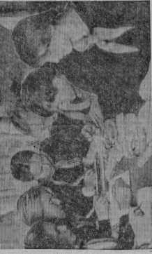
школа № 9, 5-6 класс.