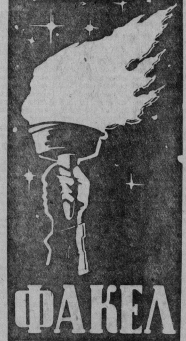
Ежемесячник для молодежи и о молодежи Сентябрь 1972 года № 9 (51)