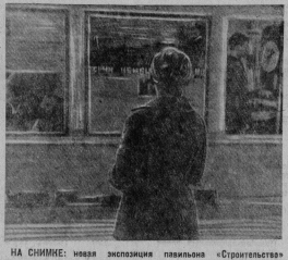
На снимке: новая экспозиция павильона «Строительство» «Научно-техническое творчество молодежи».