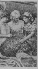
КАПРАККУМСКИЙ КОЛХОЗНИК КОМБИНАТ

ТАИР МУХАМЕДОВ , лауреат Государственной премии СССР, заслуженный ирригатор Таджикинской ССР.