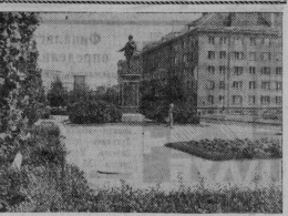
Столица Эстонской ССР — Таллин. Памятник В. И. Ленину.

После коллективизации преобразовалось сель- ское хозяйство республики. Исчезают послед- ствия голода. Приспешивается переход к новой буластроустроенные поселения городского типа. Ин- тенсивно механизация сельского хозяйства Эстония СССР не имеет ни одного отстающей страны мира. Сейчас на ее полях сидит 27 тысяч тракторов (в пересчете на 15-контный) более 3 тысяч зерноуборочных комбайнов, 10 тысяч грузовиков. Благодаря высокой механизации каждый работник села производит зерна, продукции, достаточную для снабжения 16 человек. В сельском «Центральном» на содвигной эстонской специализации уникальной заботы рафинированной и радиофинированной карте Современные Спектр, выходящий площадь бо- лее двухсот квадратных метров, можно про- следить, как изменялся индустриаль- ной области республики за годы Советской власти и какими он ставит и концы пятилетки. Приглашаем вас совершить своеобразное путешествие в навальном Выставке по мар- шруту «Эстония на ВДНХ СССР».