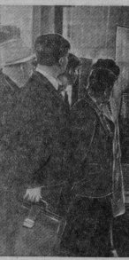
НА СНИМКЕ: в павильоне промышленности строительных материалов ВДНХ СССР.