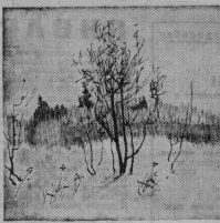
Зимний пейзаж. Рис. Н. Петрова.

Прости меня, прости За сложность чувств. Любовь! — ее найти У тебя учусь. Давно जाता твою Я знаю науку. Порой в них солодовый, Порой в них скрыты, И верно горюет: За счастьем поспешни, Коль выражает взгляд Всю глубину души. А. ВАСИЛЬЕВ.