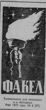
Ежемесячник для молодежи и о молодежи Май 1973 года № 4 (57)