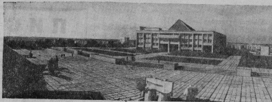
Новый Дворец пионеров в городе Киреево... В архитектурном отделении...