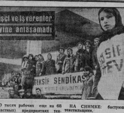
НА СНИМКЕ: вступающие текстильщики.

★ ТИПУСНО. Рост Дорожного управления жилищного уровня выкудуют турецких текстильщиков. Работы за свои права, которые начались в Турции, за улучшение жилищных условий. Объявили забастовку текстильщики в четырех текстильных фабриках и до тысяч рабочих еще на 68 (частях) предприятий текстильной промышленности.