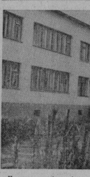
И в снимках: (справа) новый детский садик; (вверху) в сельской школе.

С отличным настроением работает на молочном, любительном для нашего колхоза году колхозница Нечесовой животноводческой фермы. За последние восемь месяцев наши доярки получили по 3170 килограммов молока от каждой коровы в среднем, а в целом по ферме дали его 1170 тонн.