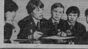
Член клуба «Юные пионеры».

Писательская работа является делом не простым. Среди выдающихся русских поэтов Николай Некрасов, Николай Некрасов, Николай Некрасов, Николай Некрасов.