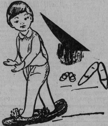
Без слов. Рис. В. Ольгина.

Красный, красный Светкин конь, Он горячий, как огонь. Только вот обидно, Что педали видно. Е. ШАПОРЕВ.