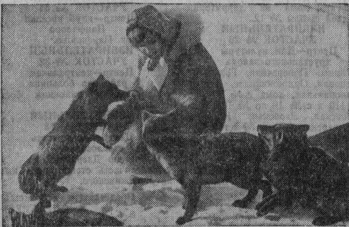
ДЕНИНСКОЕ ЗНАМЯ 2 СТР. 7 АПРЕЛЯ 1982 ГОДА

ДО НАЧАЛА совещания гости курловцев могли познакомиться с деятельностью рационализаторов и изобретателей района. В зале заседаний главной конторы стеклозавода им. Володарского были развешены на стенах и разложены на столах фотоматериалы, плакаты, творческие и тематические планы, журналы, телью социалистического соревнования новаторов.