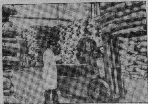
«Предусмотрено значительно увеличить выпуск заменителя цельного молока, что позволит высвободить молоко на пищевые нужды».