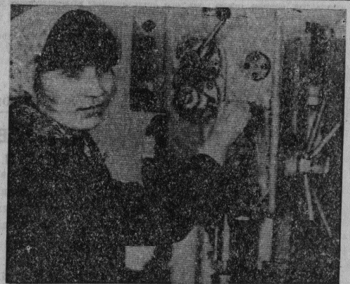
С каждым годом развивается учебно-материальная база Гусевского стекольного техникума. Помимо обширной теоретической подготовки, будущие специалисты стекольного производства должны иметь хорошие практические навыки. Учебную практику учащиеся проходят в слесарных и механических мастерских. Они оснащены всем необходимым для этой цели инструментом, оборудованием.

ЭТУС оказывает помощь в ведении грамотного технического надзора за строительством линий связи, которое ведет механизированная колонна № 707. По заявкам колхозов и совхозов телефонизируются наиболее важные объекты в сельской местности: фельдшерские пункты, школы, детские сады.