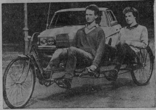
Бремен (ФРГ). Необычный двухместный велосипед сконструировали эти изобретательные молодые люди. Вот так, доложно уютно расположившись на сиденьях, они развивают среднюю скорость — 40 километров в час.