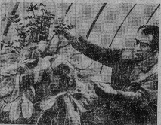
В.П. Рациональный способ выращивания овощей, зелени, цветов, позволяющий экономить полезную площадь, энергоза-

траты и труд, применяется работниками сельскохозяйственного производственного кооператива «Бочкан» в Хайдукахазе.