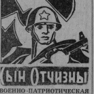
ВОЕННО-ПАТРИСТИЧЕСКАЯ СТРАНИЦА Выпуск посвящается Дню Советской Армии и Военно-Морского Флота