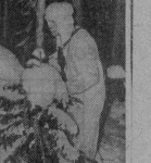
Северо-Западного фронта в своем оружье. Днем в ночь, и ночью, воевал вместе с командой в освобождении родины.

Отличные результаты в социальном воспитании достигнуты в честь 40-летия Великой Победы в прошедшем XXVII съезде КПСС избрана в члены одного из лучших подразделений пограничной части. Более 50-летием в качестве старшего лейтенанта на подразделении являются отличниками боевой и политической подготовки, до проведения — заслуженными специалистами. На границе страны постоянно ощущает тепло родины, своей страны.