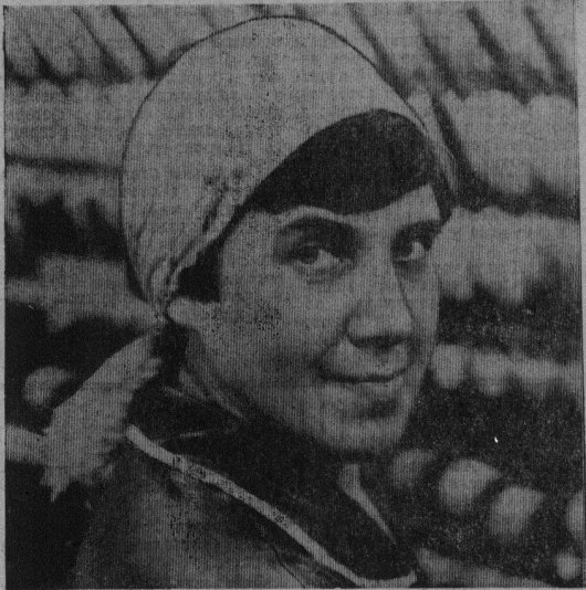
Более двадцати лет трудится в производственном объединении «Стеклозавод» коммунист

С. МАКЕВА, редактор радиовещания завода.