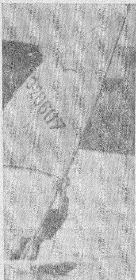
С волной и ветром спора.