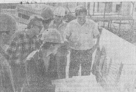
ЛЕНИНСКОЕ ЗНАМЯ 2 СТР. 8 АВГУСТА 1987 ГОДА

РАБОЧИЙ поселок Курловский просыпается рано. Люди спешат на завод, мебельную фабрику, на хлебокомбинат, в лесхозхоз. Во дворе детского сада выстраивается целая вереница ползков. Открываются магазины. Вкусно пахнет печеным хлебом.