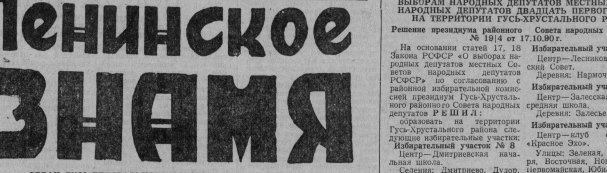
ОРГАН ГУСЬ-ХРУСТАЛЬНОГО ГОРОДСКОГО И РАЙОННОГО СОВЕТОВ НАРОДНЫХ ДЕПУТАТОВ, ГОРКОМА КПСС

Газета основана в сентябре 1930 года № 172 (11625) ПЯТНИЦА, 20 ОКТЯБРЯ 1990 ГОДА Цена 3 коп.