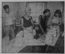
Санкт-Петербург. После много рублей можно приобрести лучшего переярка замечательная фирма «Зингер» переярка в плетение швейных машин, горда на Неве. В универсаме «Спорт» на проспекте Шауля, на откуп салот по продаже ее продукции. Здесь за ССВ и

беспроцентной ссуды на закупку кормов колхозам и совхозам — 50 млн. руб. фактически перечислено — 50 млн. руб. 5. Кроме того, из областного бюджета перечислено напольской на развитие социальной сферы села — 217 млн. руб. на 10.09.92 г. 6. Выделено из областного бюджета на дотацию семейного зерно ОИХ Минздрав — 1 млн. руб., вылате дотаций на сельскохозяйственную продукцию и продукцию скотам в III квартале 1992 г. — выделить 145,95 млн. руб. фактически перечислено — 92,17 млн. руб. 7. Всего выделено из областного бюджета 673,67 млн. рублей,