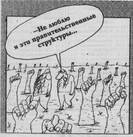
Рисунок В. Шинова