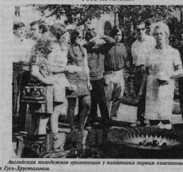
Австрийская молодежная организация у пакетики первым комсомольцам в Гусь-Хрустальном.

Родился она в Ленинграде. Мать трагически погибла, когда мше шестой год, в 1941 году ушел на фронт и не вернулся отец. Детский дом. По дороге в Тюмень ван шиболом обстреляли фашисты. Направили в Пинжский детский лагерь, а когда ушиблены налеты бля Ленинград, мне эвакуировали в Тюменскую область.