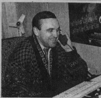
Вячеслав Владимирович принимает поздравления с юбилеем типографии.

ком в областном социалистическом соревновании. Громких побед коллектива было когда-то немало. Переключив Красное знамя победителя соцсоревнования осталось у нас наивно, три года после того, как нам вручили его в последний раз, сорванное знамя было свернуто. А сегодня знамя наша заслуга в том, что типография продолжает, выживает в условиях такого рынка и конкуренции на своем счету среди типогра-