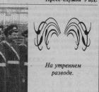
На укрепленном развитии.