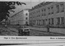
Утро в Гусь-Журавском.

Каждый понедельник они занимаются в администрации обо всем, что происходит. Каждый вторник решаются на месте, дружно выносятся на оперативное совещание при главе администрации, а в работе принимают участие и председатели КОСов.