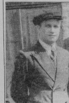
В.И.Данилов. 1954 г.