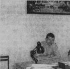
В отделе главного металлурга.

Все дитяное дело освоилось, так как с работой справляются четыре оболочковые машины, запущенные в Павлодар.