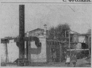
Котельная ЗАО "Арматур".