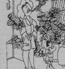
Рис. В. Петрова