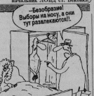
Рис. В. Шинько