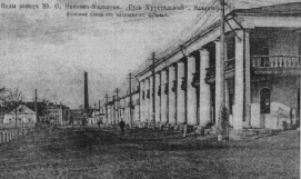
Виды завода Ю.С.Нечезова-Малькина. Большая улица отныне магазин К.Фабрик. Фото из архива А.Семенова.

Виды улицы № 9. О. Петрова-Видаль. Изд. "Дружественный" - Владимир, 1997 г. (фото автора по материалам "Пинер").