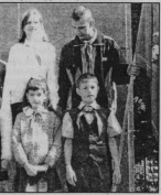
Торжественные минуты приняты в пленере.

Работа велась на трех учебных точках: на базе Гусь-Хрустального ОПЧС (нач. С.Губеев), Гусевского лесхоза и ОАО «Трусовый». После учений прошло заседание районной чрезвычайной комиссии, где подвели итоги и обсуждали действия различных служб по ликвидации торфяных пожаров и лесной пожар, угрожающей пос. Ивацки. Действия всех подразделений