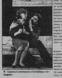
■ Сцена из спектакля «Гостиница «Астория».

— Успех открыли? — безусловно. Следующим был спектакль «Шесть Гостиница «Астория». Пьеса о первых днях войны, о блокаде Ленинграда, о суровости и мужестве. Но... «Считает спектакль неудачным. Почему? Не знаю. Может быть, потому что сама тема тяже-