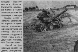
Поздравляю всех работников села и перерабатывающей промышленности с профессиональным праздником, желаю крепкого здоровья, счастья на долгие годы, успехов и удачи в труде, семейного благополучия. Нашей вам поклон за великий труд, за хлеб. Мира и радости в доме!

По традиции во второе воскресенье октября в Российской Федерации проводится итоги сельскохозяйственного года, на торжественных собраниях встречаются работники села и перерабатывающей промышленности, сервисных организаций, отдавая дань глубокого уважения их нелегкому труду по обеспечению нас необходимыми продуктами питания, сыром, услугами. В сложнейшее время работает наше сельское хозяйство. Это не всегда приемлемые экономические и финансовые условия для сельскохозяйственных товаропроизводителей, да и погодные условия в последние время не благоприятствуют тому, кто работает с землей. В текущем году, несмотря на недостатки техники и финансовых средств, район успешно откочевал и собрал по отдельным культурам неплохой урожай. Зерна собрано по району более 2 млн. тонн, при урожайности 16,8 центнера с гектара уборочной