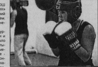
Женский бокс «Атлант» - это круто.