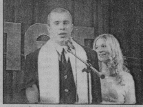
■ Предприятие поздравляет учащихся ПУ-47.