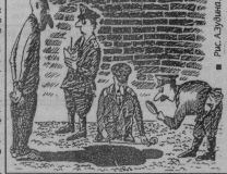
■ Рис. А.Зубанов.

26.10.2001 в д. Мокрое во время распутия сплитных наливных в квартире гр. Н. произошла кража, по треве которой гр. К. нанес ножевые ранения в область лица и шеи хозяину, который от полученных травм скончался. 27.10.2001 г. неизвестное лицо путем взлома запорного устройства на входной двери, проникло в хозяйственный сарай, откуда похищено картофеля и продукты питания принадлежавшей гр.ка. С. Ущерб 2500 рублей. 28.10.2001 г. неизвестное лицо путем взлома запорного устройства на входной двери, проникло в хозяйственный сарай, принадлежавший гр.ка. Ю., проживающей в п. Гусевский, откуда похищено консервированные продукты питания, на сумму 2320 рублей. 28.10.2001 г. неизвестное лицо разбил оконное стекло на балконе, проникло в квартиру гр.ка. К., откуда похищено личные вещи на сумму 1100 рублей.