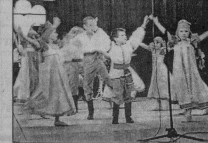
■ Танцуют учащиеся подшефной школы № 13 (рук. Д.Козлова).