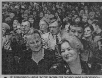
■ В зрительном зале царил хорошее настроение.