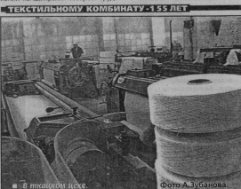
В Текстильном комбинате «155 ЛЕТ»

Наши реквизиты: ИНН 331490583 р/с 4060381030002000992 БИК 04610000 РКЦ г. Юс-Хрустальный. (Безналичный перевод для детей и подростков в пос. Урильском).