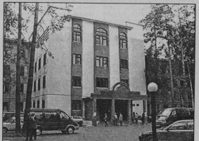
■ Административное здание АО «Стеклохолдинг»