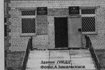
Зинаида ГИДА

Вторник, четверг - регистрация личного автотранспорта. Среда, 2-я, 4-я этажи - прием экзаменов. Пятница - регистрация государственных транспортных и а/м иностранного производства. Пятница, суббота - обмен и выдача водительских удостоверений. Воскресенье, понедельник - выходной. Часы работы с 9 до 18 часов, перерыв с 13 до 14 часов.