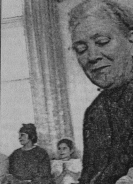
■ Рядом с аушком.

Выражаем надежду, что не только дети, но и взрослые население города будут снова активнее участие в создании и дальнейшей работе музея.