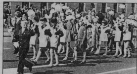
■ На перемойской демонстрации.