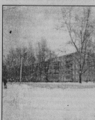
На снимке С.Штильня: Тепловый проспект.