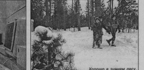
Хорошо в зимнем лесу.