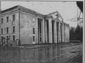
Детская школа искусства.