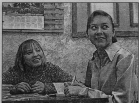
Все начинается с улыбки.

Но это только начало! Все девушки пригласили участвовать в городском конкурсе юности. Мы искренне желаем им успеха!