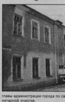
главы администрации города по санитарной очистке.