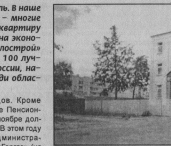
— Видно, напрямую связываясь с жильцами, требовая возросли, в частности по теплопроводности. Утеплители, чердаки, подвалы и т.д. Есть задумки перейти на каркасное строительство жилья. На наш взгляд, это перспективно, для применения электротехнических инструментов.

На заводе имени Дзержинского делаем пристройку к так называемому автотранспортному цеху. Здесь идет производство стекловолокон-