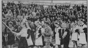
К 60-ЛЕТИЮ СТАЛИНГРАДСКОЙ БИТВЫ

Телефоны для справок по будущим пенсионерам города 3-28-03, района - 2-52-02.