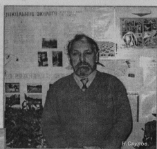
РЕАЛЬНЫЕ ДЕЛА ЮНЫХ ЭКОЛОГОВ