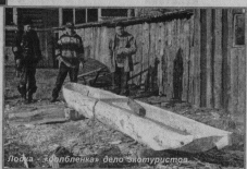
Юноша «впитывает» дело экологического

Обучаясь географической съемке местности, учащиеся могли увидеть много удивительного в родном крае. Запечатлены на фотографиях гордые лебеди на озерах гряд, есть симки тарнгула, следы росомахи и т.д. Создаваемые ими дневные планки в основе экологического туризма, кажет практическое применение.