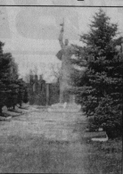
Глава администрации города Гусь-Хрустальный

— Что и могу сказать? Депутаты работают, заседания проводятся. Все нормально, опытные специалисты. И между нами есть взаимопонимание.