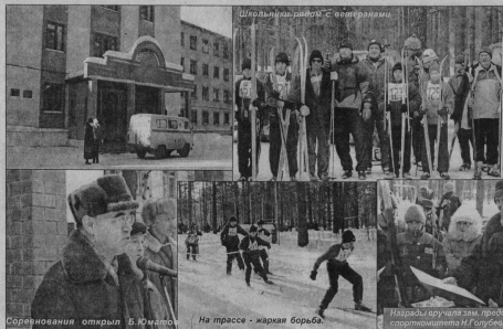
Школьные дети с ветеранами