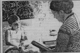
Бабушкины сказки.