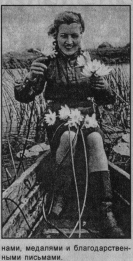
Медалью и благодарственным письмом.

Девчата уже умели стрелять из винного орудия, исать и исправлять порывные провода связи, находить по звуку немецкого самолета в развинутом полете. В тот год К Лазарева вернулась домой в звании ефрейтора, награжденная средне