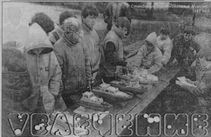
Стенофонд спонсорства Муромо, 1997 год.

СТРАНИЦУ ПОДГОТОВИЛА ОЛЬГОВА. КОМПЬЮТЕРНАЯ ВЕРСТКА И КУЗЬМИНА, РИСУНОК К. ПЬЛОВА