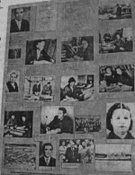
С них начинается НИИС