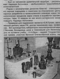
Экспозиция цеха форм ОАО «Красное Эхо».