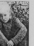
Безнадзорные дети в возрасте шести вовлекают в преступные группы. В прошлом году подростки без родителей были задержаны, 59 из них в группе, 53 - преступники. Это разбои, грабежи, нанесение тяжких телесных повреждений, 29 краж, а за всем за ними - безнадзорные дети, их частые обращения безнадзорные. Вот где источник бедности. Поимать такие условия, государство в целом. Но это уже тема другого разговора.

сразу же, как поступило сообщение. В прошлом году в розыске находилось по городу и району 54 подростка. Остались трое, которых мы объявили в федеральный розыск. Как правило, беут из неблагополучных семей. За последние три ситуации. Едут поспрашивать во Владимир, Москву. К сожалению, такие ребята быстро привлекают к наркотикам, употребляют токсические вещества. Наравним таких к наркологу. Во Владимире открыто наркологическое отделение для подростков. Тех, у кого тяжелое состояние, отправляем туда. За 2002 год прошли лечение 10 человек. В январе этого направляли уже 7.