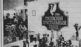
Марка Гусевского хрустального завода широко известна и высоко ценится не только по всей России, но и за ее пределами. И никакие псевдонимы телерафии не смогут унизить достоинства гусевскоо хрустала.

Начало в 18.20 на канале RENT-TV, повторение на следующий день в 0.00. Ежедневные рекламные объявления «бурная ссора» на канале «Арктика». Дни «Остава» начато в 18.20 на канале «Россин» (без Владимира) 26 и 28 марта.