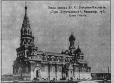
Васьи завад Ю. О. Юрьевича-Мальцова. Изг. Курганец, 1746 год. Музей, г.б. - Тула

Приписанные Акимом рабочие люди образовали возле