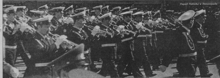
Парод Победы в Ленинграде